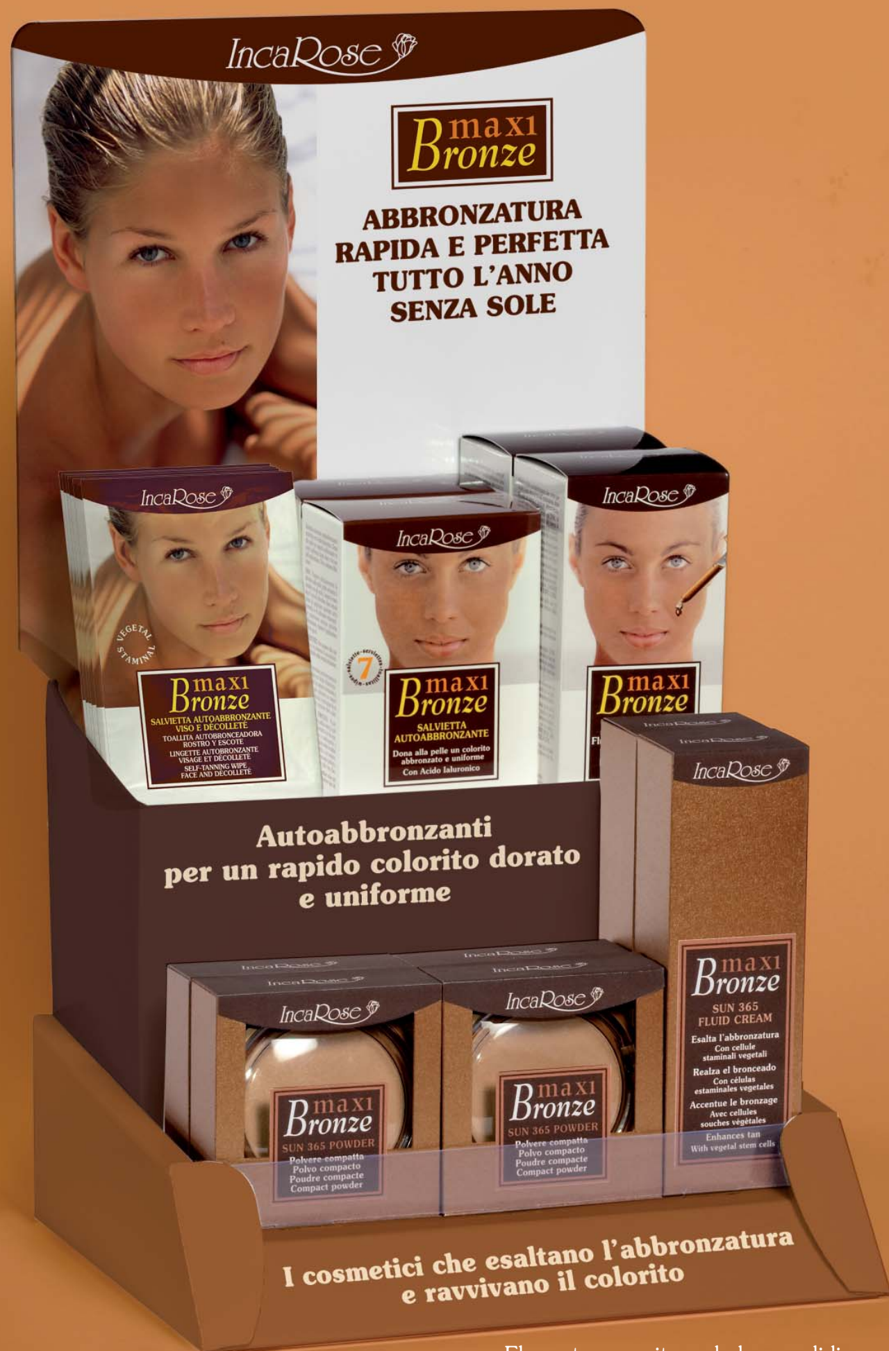
Elegante espositore da banco di linea